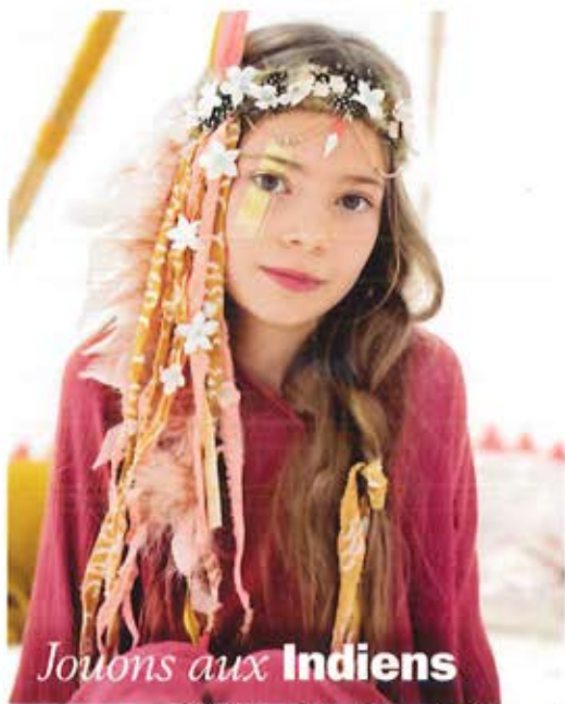
Jouons aux Indiens