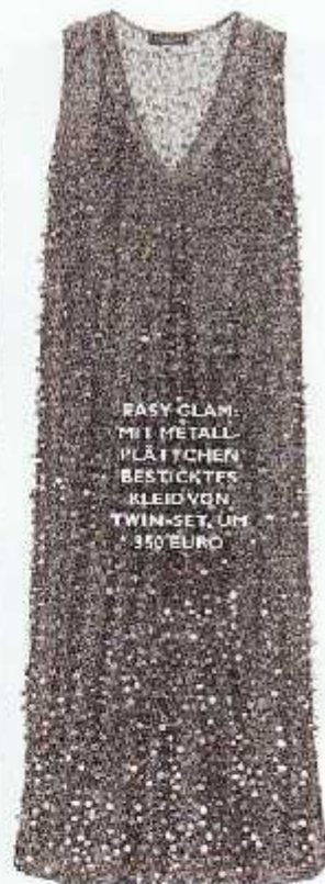
EASY GLAM MIT METALLPLÄTTCHEN BESTICKTES KLEID VON TWIN-SET, UM 350 EURO