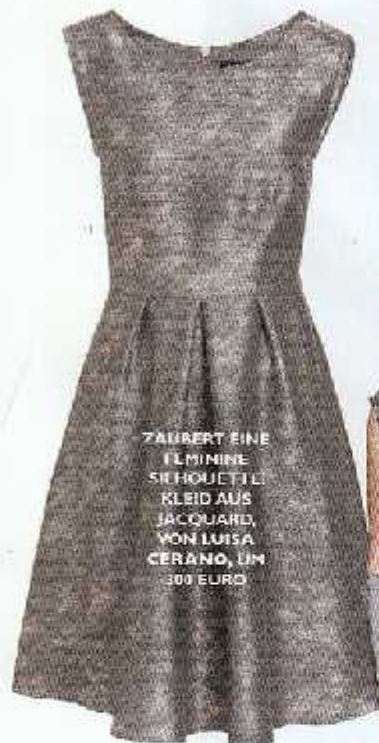
ZAUBERT EINE ELMININE SIKHOUEIT KLIED AUS JACQUARD, VON LUISA CERANO, UM 300 EURO