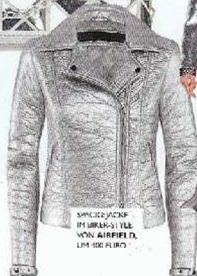
SPACE JACKE IM BIKER-STYLE VON AIRFIELD, UM 100 EURO