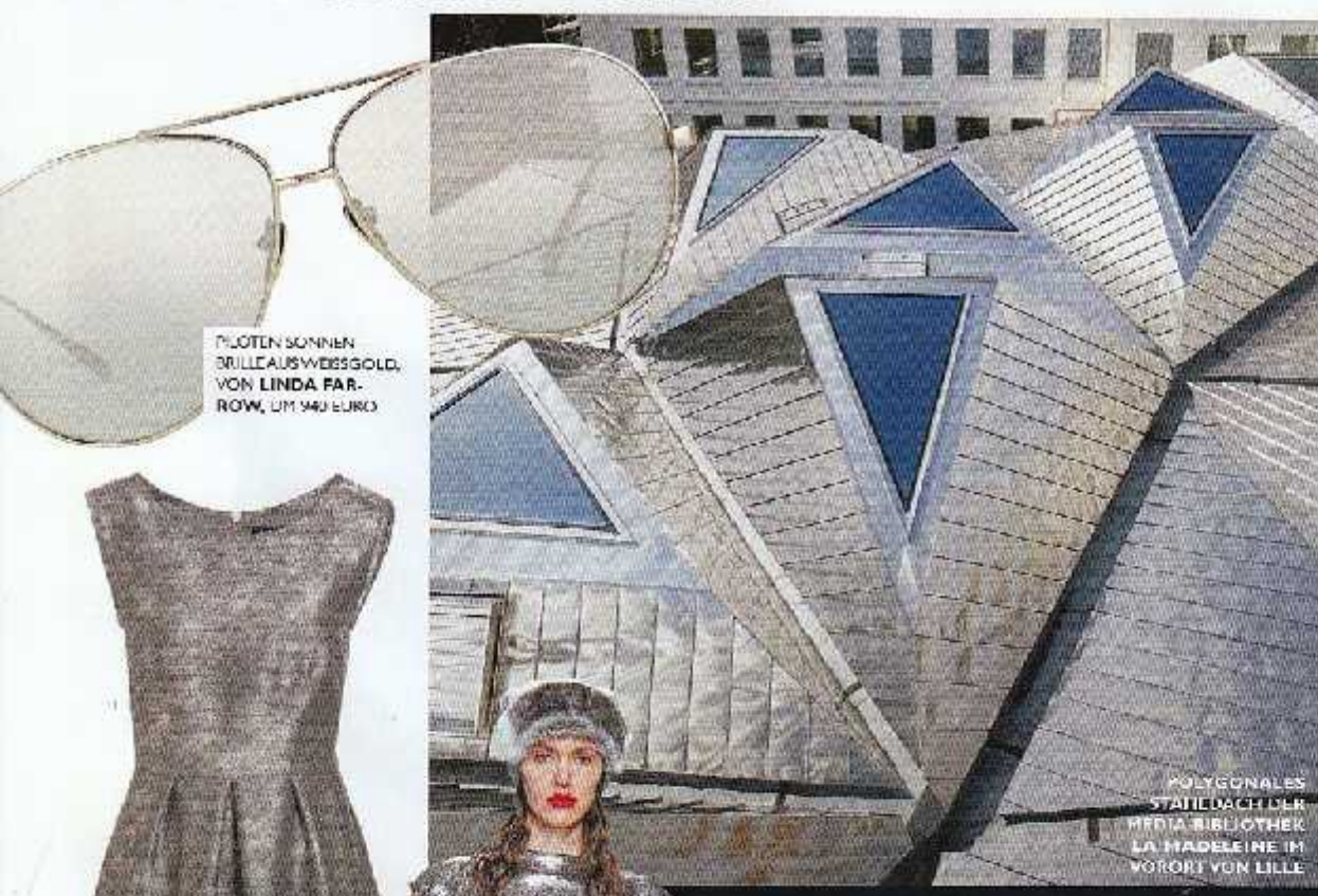
PILOTEN SONNENBRILLE AUS WEISSGOLD, VON LINDA FARROW, UM 940 EURO