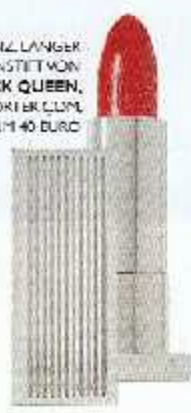
VOLLER GLANZ LÄNGER HALT: LIPPENSTIFT VON LIPSTICK QUEEN, ÜBER NEHA-PORIER.COM, UM 40 EURO