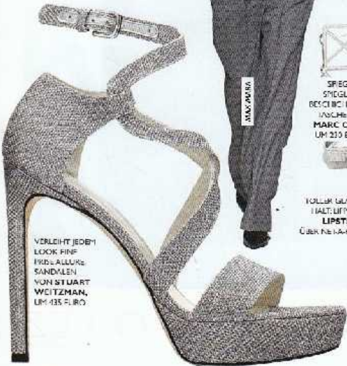
VERLEIHT JEDER LOOK HINEIN EINE ALLEURE SANDALEN VON STUART WEITZMAN, UM 135 EURO